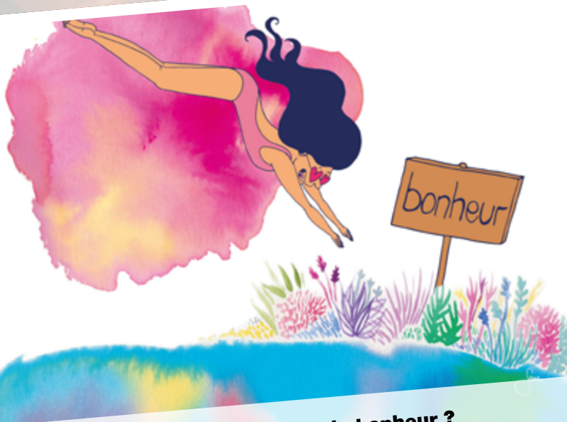
Exposition : la possible quête du bonheur ?