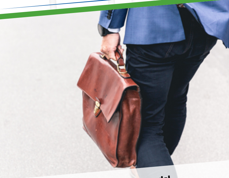
Départ d'un membre du Conseil synodal