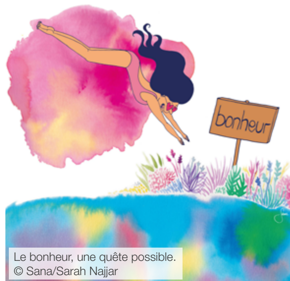
Le bonheur, une quête possible.

Les quatorze panneaux de l'exposition ne prétendent pas faire le tour du sujet, mais offrent des pistes de réflexion, en se référant à plusieurs domaines des sciences humaines et sociales, comme la philosophie, la psychologie, la théologie, l'éthique, ou encore la biologie. C'est ici une sorte de boîte à outils qui est proposée. En compagnie de penseuses, penseurs, chercheuses et chercheurs du passé et du présent, les visiteurs et visiteuses sont invité-e-s à prendre un peu de temps pour plonger dans la pluralité de la question du bonheur.