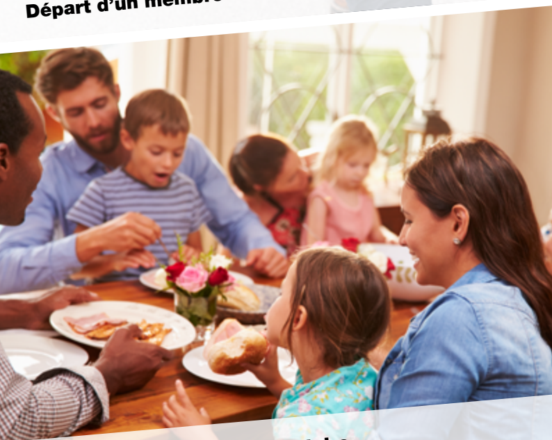
Développer la vie communautaire