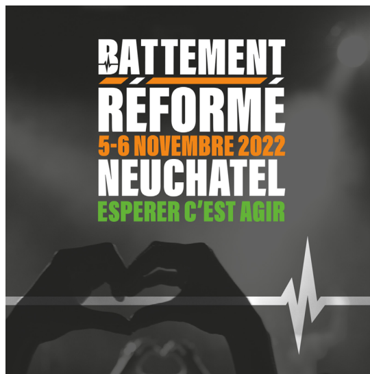
24h pour partager, prier et célébrer ensemble !

Pour contribuer à la réussite du festival, toutes les forces bénévoles, en groupes ou en solo sont bienvenues. Le festival repose aussi sur votre générosité.