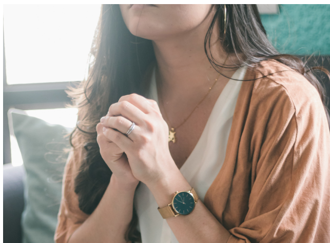
Prendre un moment pour être dans la présence de Dieu

Revenons à Dieu... pour qui il est! C'est ce qu'Évangile en chemin vous propose le 18 septembre, dimanche du Jeûne, de 14h à 17h à la cathédrale de Lausanne.