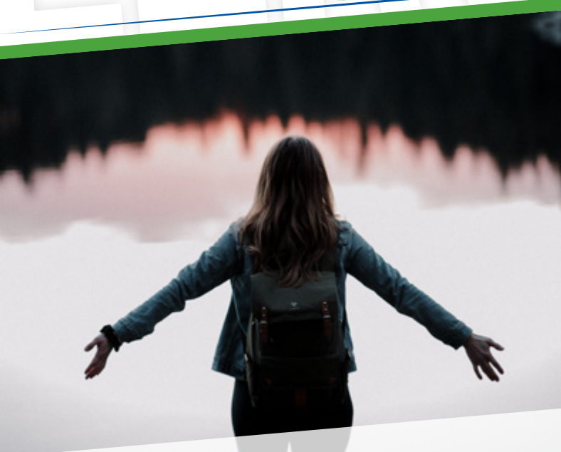
Fond pour le travail des femmes