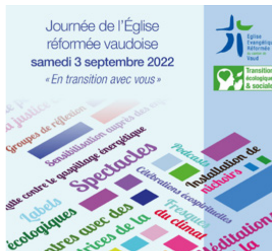
Une journée au programme riche et varié !