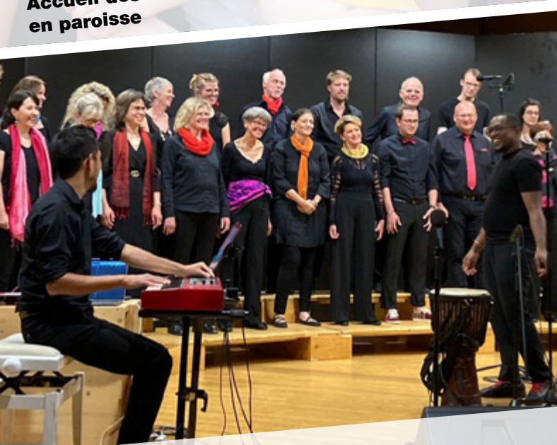
Stage de gospel à Échallens