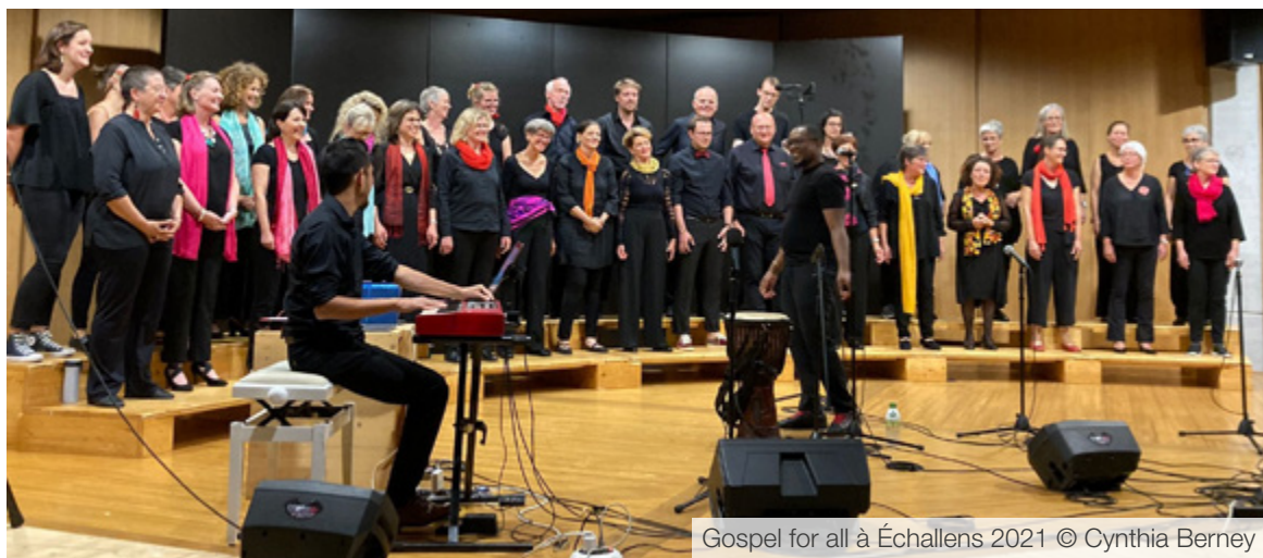
Gospel for all à Échallens 2021