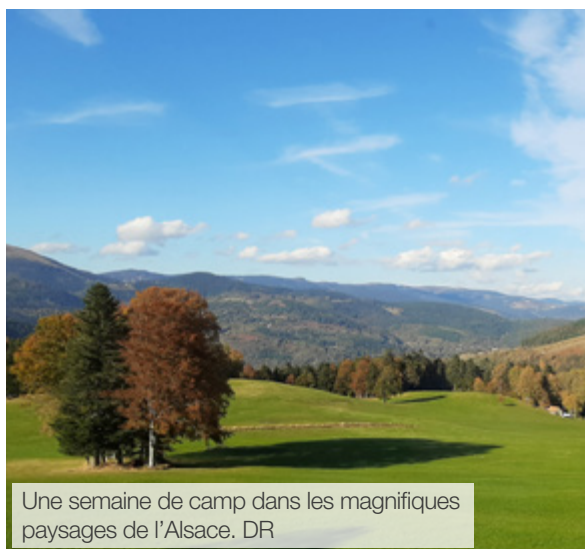
Une semaine de camp dans les magnifiques paysages de l'Alsace.

Il est né de la volonté de la Région de se centrer sur les familleS qui représentent toutes les générations. Parents célibataires, familleS composées et recomposées, grands-parents et petits-enfants sont les bienvenus !