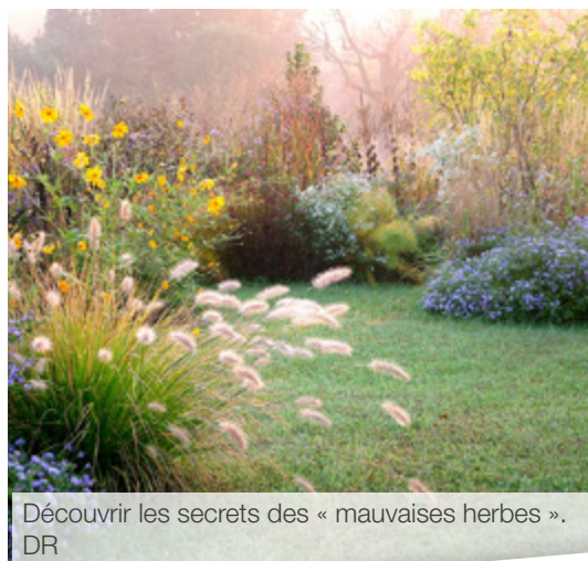
Découvrir les secrets des « mauvaises herbes ».

Retrouvez tous les détails sur le site internet.