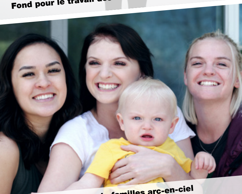
Accueil des enfants de familles arc-en-ciel en paroisse