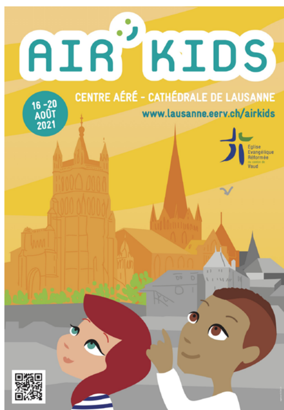
Air'Kids, à Lausanne et à Saint-Sulpice en 2021