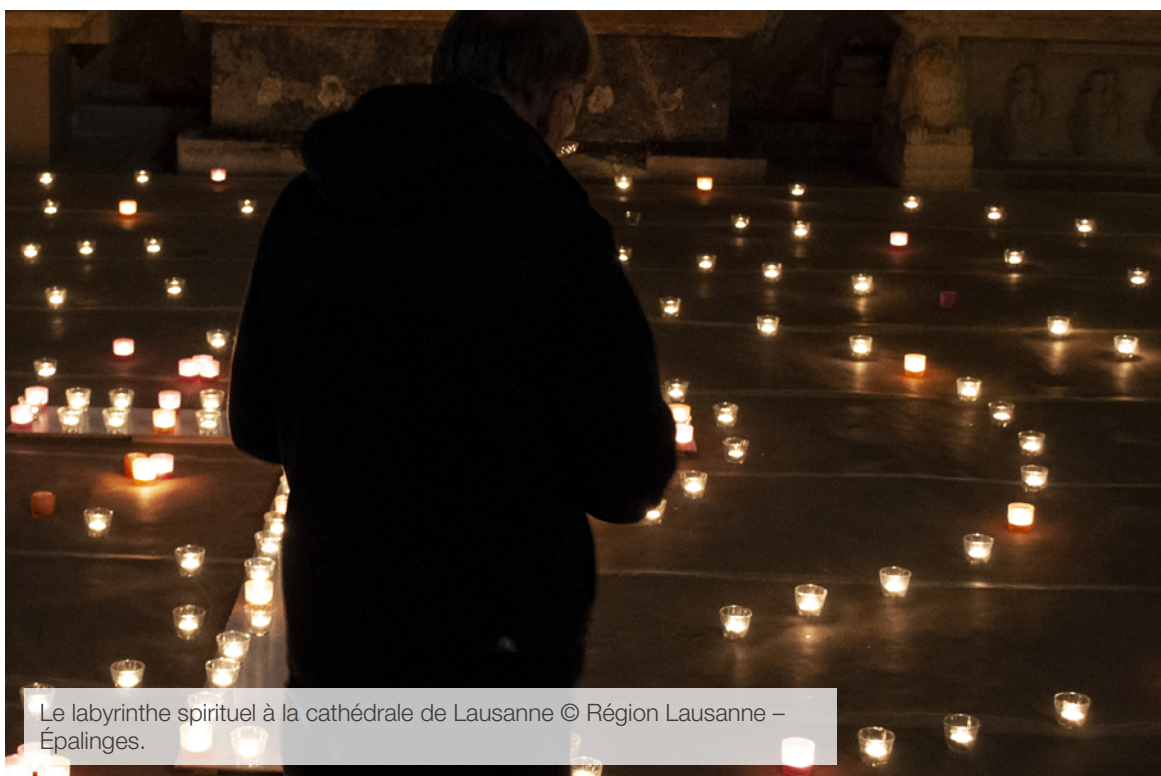
Le labyrinthe spirituel à la cathédrale de Lausanne