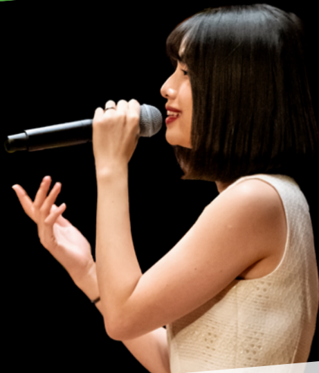
Chanteur·euse·s professionnel·le·s au culte