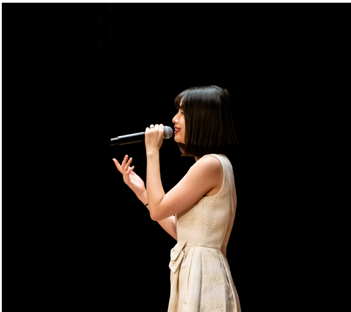
Les professionnel·le·s du chant peuvent à nouveau exercer leur art durant les cultes !

Malgré la lourdeur de la démarche, nous faisons le vœu que cette opportunité nouvelle serve notre culte au Dieu de Jésus-Christ.