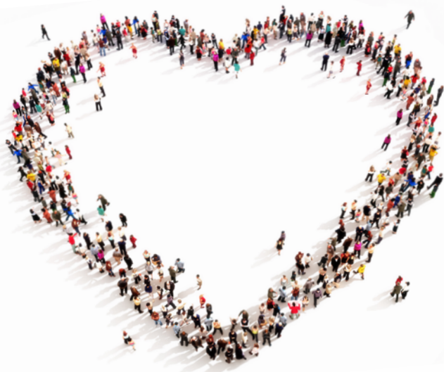
Formation : accueillir des personnes LGBTQ+ dans l'EERV