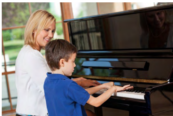
Enseigner la musique : un métier à reconnaître

L'association « Chrétiens au travail », œcuménique et proche de notre Eglise, vous invite à le découvrir avec des enseignants - passionnés ! - lors d'une soirée publique exceptionnelle jeudi 23 janvier à 20h15 à l'Espace Martin Luther King (salle de Saint-Laurent) à Lausanne.