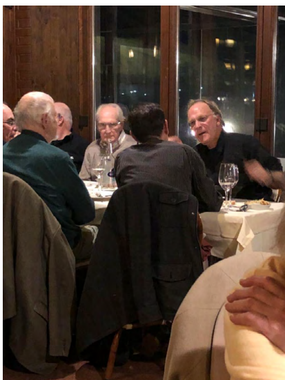
De bons moments partagés

Le 25 novembre dernier, les ministres et employés partant à la retraite en 2019 ou fêtant leurs 10, 20, 30, 40, 50 ou 60 ans de consécration ou d'ancienneté ont été invités, en signe de reconnaissance, pour une célébration et un repas convivial.