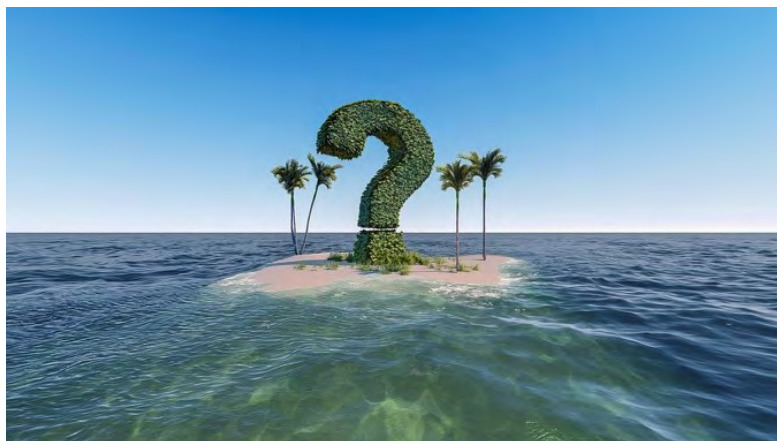
Des rencontres entre pairs

Selon sa définition classique, l'intervision est un dispositif de rencontres entre pairs, afin d'échanger les expériences et réfléchir collectivement aux conduites et comportements à adopter, des solutions à rechercher pour rendre le travail d'équipe fluide et efficace.