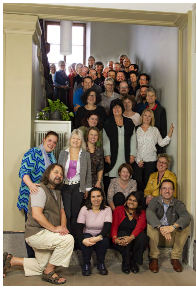
Prenons soin les uns des autres

Bonne année et que cette nouvelle décennie nous encourage à cultiver le bien vivre ensemble, prendre soin les uns des autres et donner le meilleur.