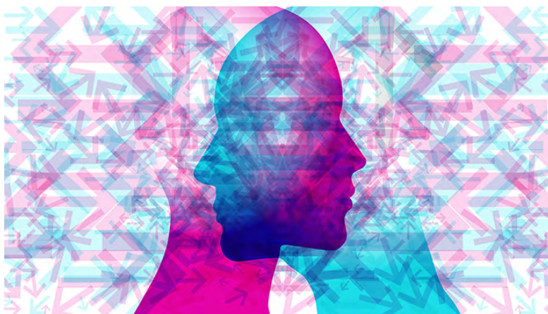
Orientation sexuelle : oui à l'extension de la protection contre la discrimination

Le Conseil synodal soumet à la réflexion des lecteurs d'EERV.fl@sh ces deux prises de position ci-après qu'il a reçues. L'une du Conseil de l'EERS (anciennement FEPS) et l'autre du groupe mandaté par lui pour réfléchir à l'accueil des personnes LGBTI+ dans l'EERV.