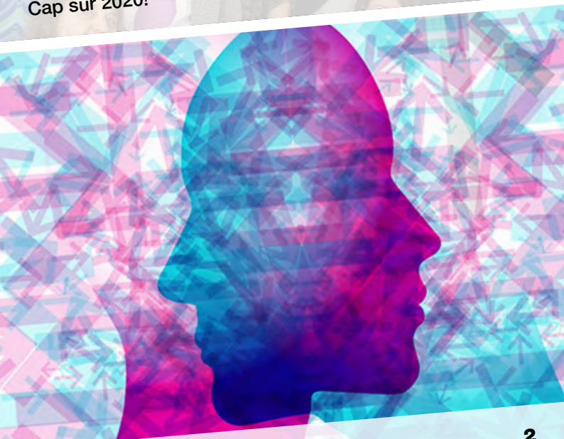
En vue des votations du 9 février