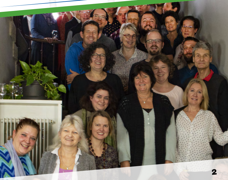
Cap sur 2020!