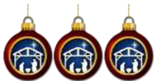
TABLEAU DES DONNÉS ET OFFRANDES