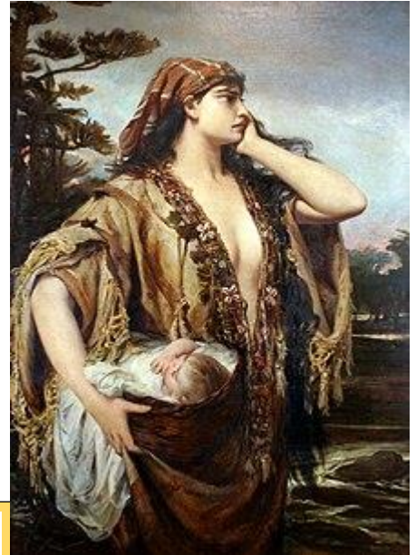
Pedro Américo (1884).

Amertume et rébellion : deux caractères de celle qui apparaît dans la Bible comme la figure protectrice de son jeune frère Moïse, osant parfois remettre en cause son droit de diriger au détriment d'Aaron qui avait le droit d'ainesse. Dans sa fausse apparence soumise, pas toujours diplomate mais toujours remplie de justice, elle vivra à l'ombre de ses frères.