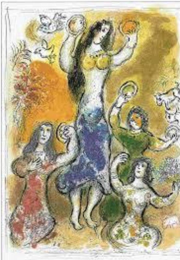
La danse de Miryam Marc Chagall

Alors Moïse et les Israélites entonnèrent ce cantique [a] en l'honneur de l'Éternel :