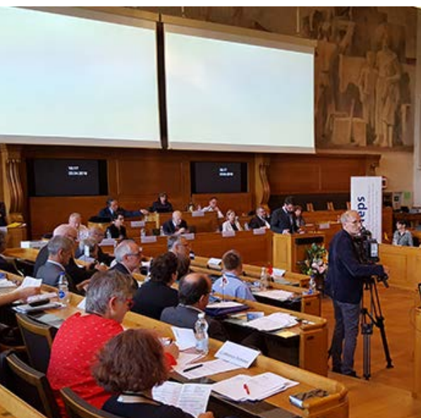
Les délégués de la FEPS en débat à l'Hôtel du gouvernement de Berne.

Lors d'une Assemblée extraordinaire, les 23 et 24 avril à Berne, les 66 délégués de la Fédération des Eglises protestantes de Suisse (FEPS) ont achevé la première lecture du projet de nouvelle constitution. Les délégués ont confirmé plusieurs décisions pour l'avenir: l'Eglise évangélique réformée de Suisse (EERS) disposera d'un Synode suisse et d'une direction tripartite, la Conférence des présidences d'Eglise sera institutionnalisée et des champs d'action créés.