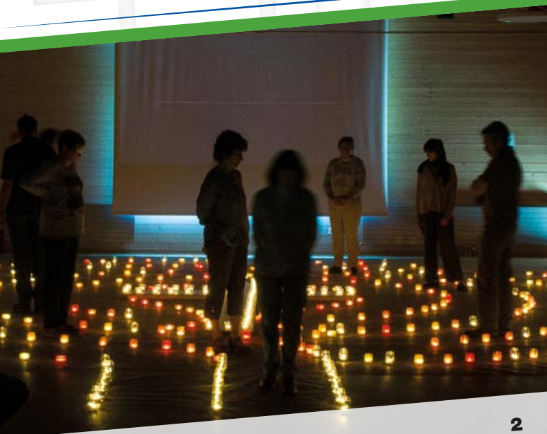
Changement de programme!