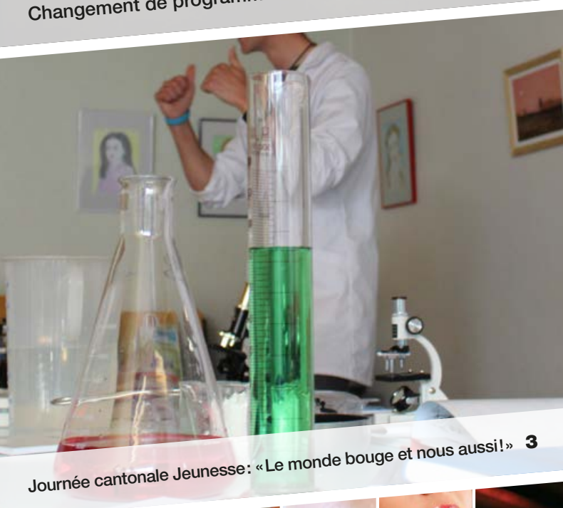
Journée cantonale Jeunesse: «Le monde bouge et nous aussi!»