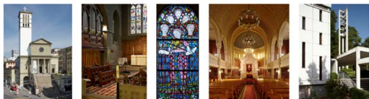
Les lieux de culte de la capitale vaudoise sous la loupe.

Les lieux de culte des deux siècles derniers sont à l'honneur du troisième guide lausannois de la collection Architecture de poche, après ceux consacrés aux écoles et aux jardins publics.