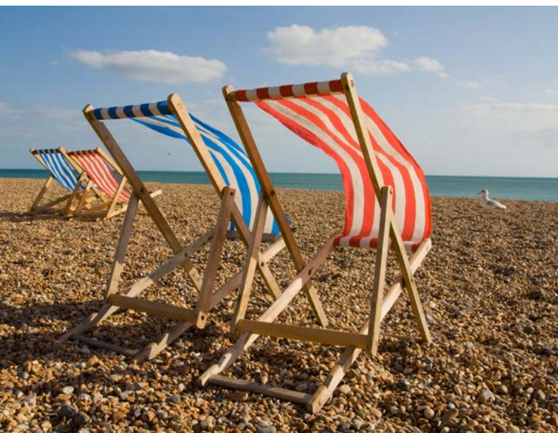
«Que ton souffle nous préserve de la paresse et du découragement.»