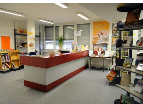
Le CIDOC reste accessible à de nouveaux horaires durant les travaux.

Comme certains d'entre vous le savent, le bâtiment qui abrite le CIDOC nécessite d'importants travaux de rénovation. La date de début des travaux est fixée au lundi 9 janvier 2017 et ce, pour une année entière.