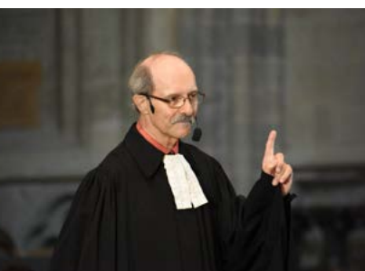
Vidéo: la prédication du culte de consécration.