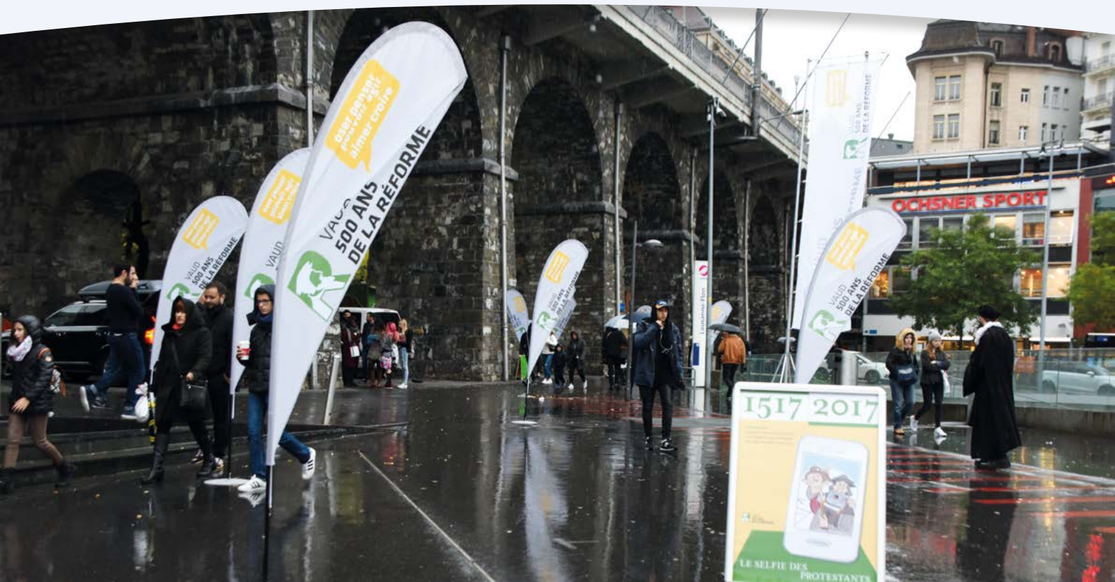
Nous sommes appelés à nous montrer publiquement.