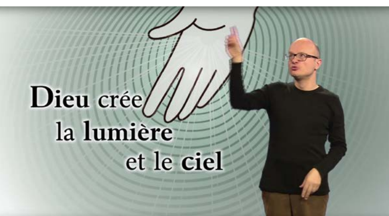
La création en langue des signes.

Après la traduction de l'Évangile de Luc puis du Livre de Jonas, les chapitres 1 à 4 du Livre de la Genèse, ont été traduits en langue des signes française!