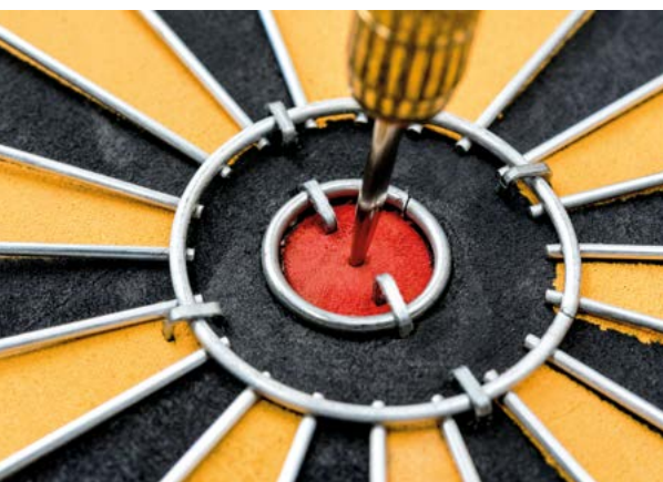
Cibles Terre Nouvelle, des dons qui visent juste.

Le service Terre Nouvelle organise deux soirées-forum d'information, d'échange et de prospective: le mercredi 12 octobre à la chapelle des Charpentiers à Morges et le jeudi 13 octobre à la salle de paroisse de Montreux, au choix.