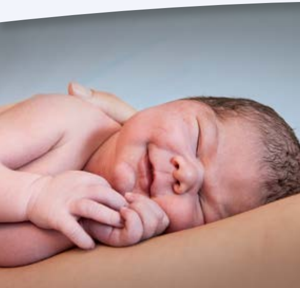
L'affiche des partisans se soucie de l'avenir des enfants.

à une effrayante spirale: pollution – dérèglement climatique – empoisonnement des mers, des terres, des animaux et des hommes – aggravation de la pollution, etc., au risque d'aboutir à une catastrophe planétaire. La Suisse continue à figurer, au prorata de sa population, parmi les pays les plus pollueurs du monde.