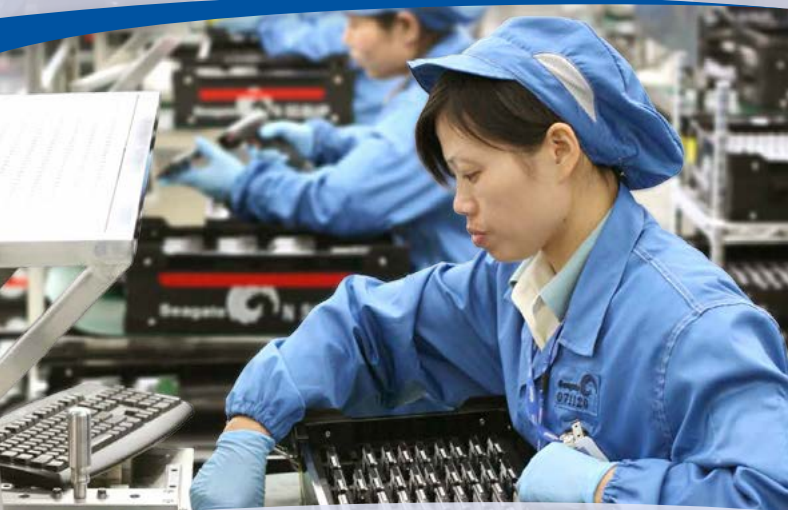
Offrande du Jeûne fédéral