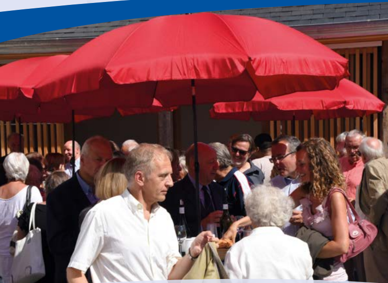
Une Eglise vivante et ouverte!