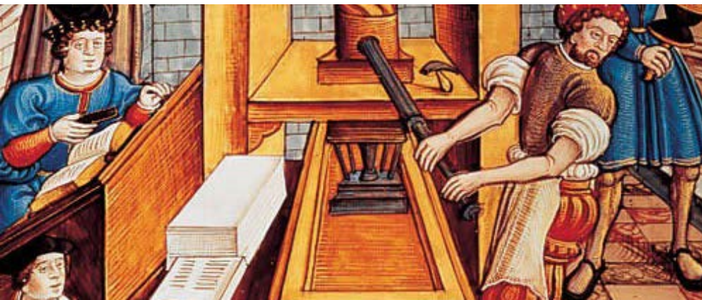
L'intrigue se déroule dans l'imprimerie utilisée par le Réformateur.