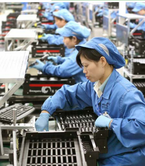
Aider les ouvrières chinoises à connaître leurs droits