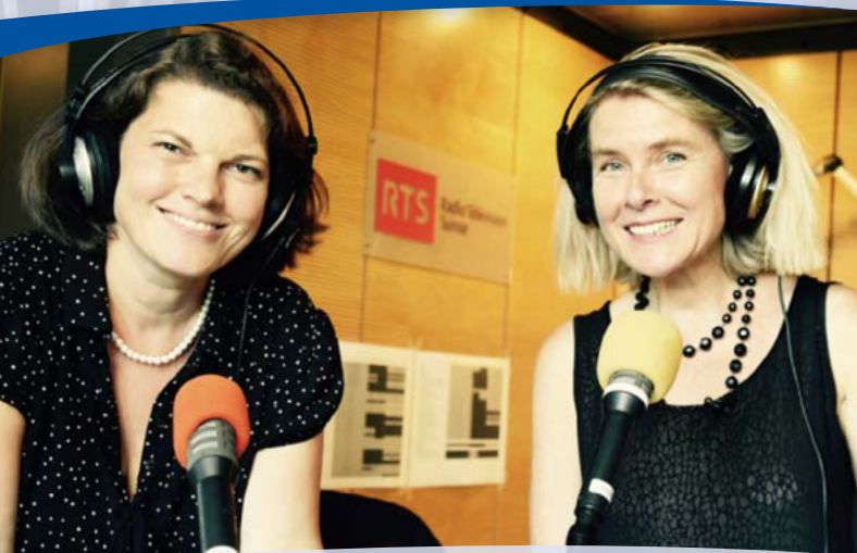
Babel, la nouvelle émission de RTSreligion