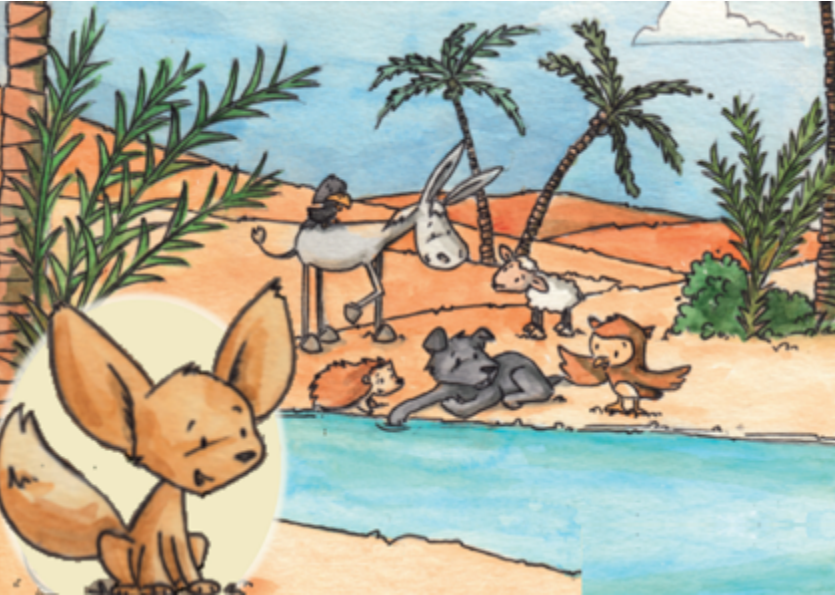
Découvrir les paraboles avec Frimousse (dessin Nicole Devals)

L'équipe de validation Chemin de vie et de foi est heureuse de vous proposer un tout nouveau programme. Cette année, c'est Frimousse le Fennec qui va nous accompagner. Ses amis vont lui raconter des paraboles et lui avec ses grandes oreilles, il va les écouter. Des paraboles qui parlent de Dieu, de soi et du Royaume.