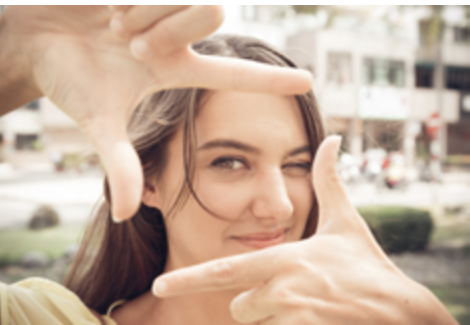
La Réforme, ça vous inspire quoi?

La Réforme, cela vous inspire quoi? Dégainez votre appareil photo et capturez votre idée pour la partager avec d'autres. Douze photos et prières seront retenues pour illustrer le calendrier 2017 des paroisses de l'Eglise réformée vaudoise. Parlez-en dans vos lieux d'Eglise.