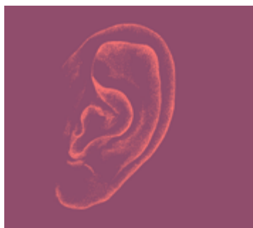
Tendre l'oreille à la création

A l'aube de son 30 e anniversaire, oeku Eglise et environnement aborde cette année un nouveau cycle consacré aux cinq sens. L'ouïe ouvre la marche. Puis de 2017 à 2020, suivront l'odorat, le toucher, le goût et la vue.