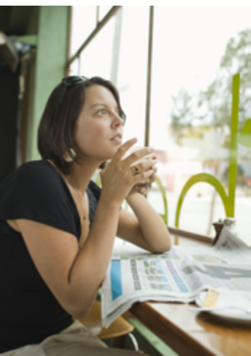
Quand la lecture du journal nous donne envie de prier

Chaque jour, les médias nous apportent leur lot de drames et d'horreurs.