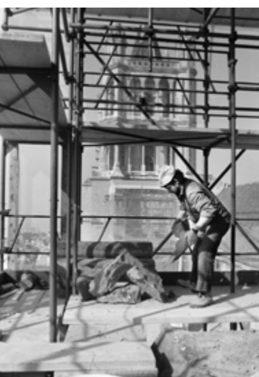
Artisan sur le toit de la cathédrale (photo © Claude Bornand).

Dimanche 1 er mai à 18h, à l'invitation de la CECCV, la Pastorale œcuménique dans le monde du travail animera une célébration sur les métiers à la cathédrale de Lausanne.